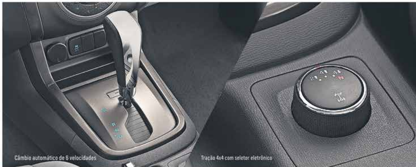
Câmbio automático de 6 velocidades